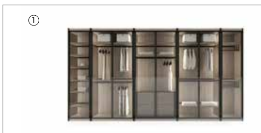
1 Miyabi composition