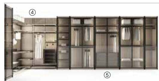
4 Reiwa composition