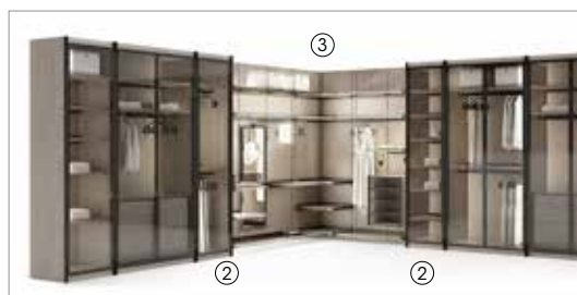
2 Miyabi composition