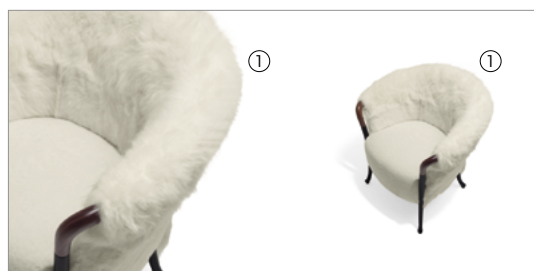
1 Progetti Fashion 33230 Katori MO02 fin.70